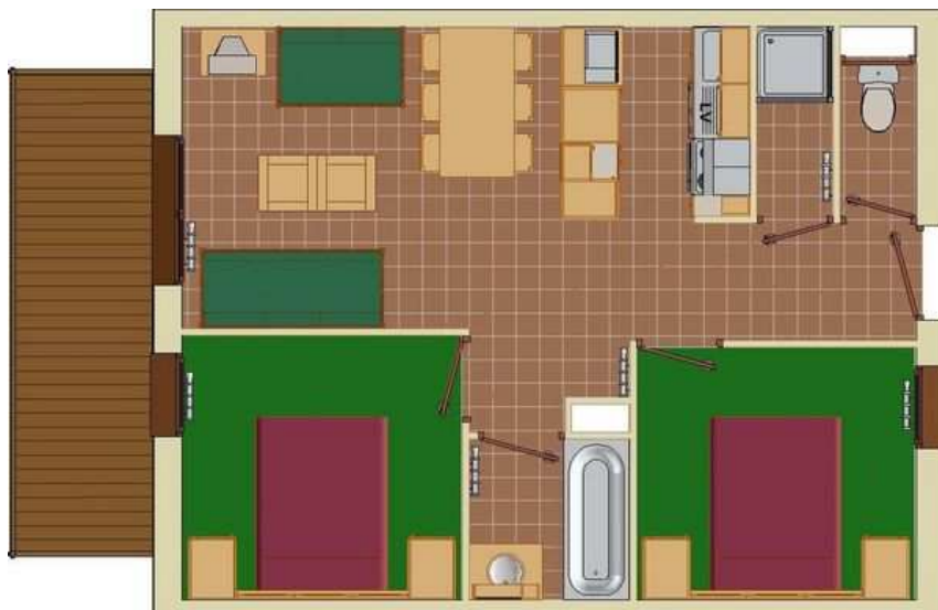
plan non contractuel / Non contractual plan

3 pièces 2 chambres séjour + banquette gigogne 1 salle de bains baignoire balnéo 1 salle d'eau 1 WC