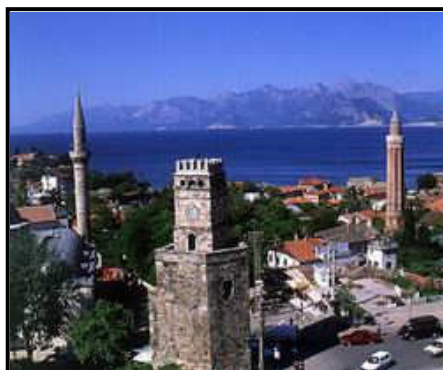
Oude stad Antalya

Prijs per persoon in dubbele kamer: € 1099