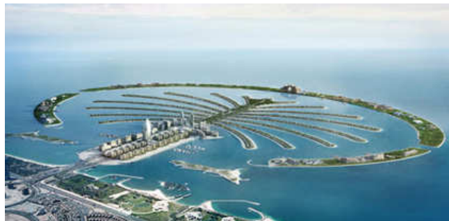
The Palm Jumeirah