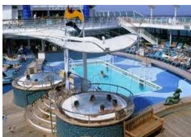
Openlucht zwembad en jacuzzi's

Het fitnesscentrum staat volledig ter uwer beschikking, en de waaghalzen kunnen hun kunsten demonstreren op een klimmuur op het sportdek. Speel een partijtje basket, of wat dacht je van biljarten op een zelfbalancerende biljarttafel! Het immense casino mag u ook zeker niet overslaan. Aan boord is eveneens een animatieteam dat zorgt voor de nodige ambiance. U kan zich onmogelijk vervelen !