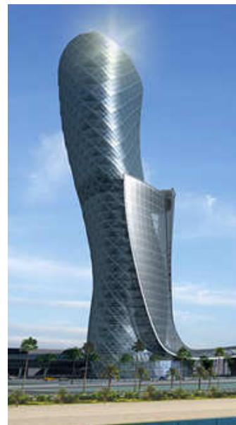
architectuur in Abu Dhabi