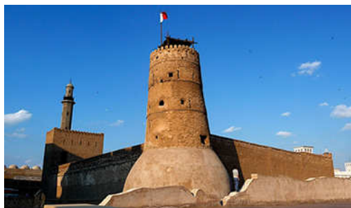
Dubai museum in Al Fahidi Fort

Inbegrepen excursie : rondrit in Dubai vanaf de luchthaven tot aan de inscheping