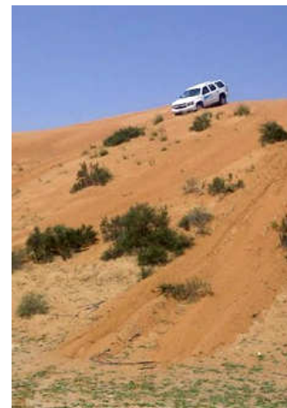
4x4 woestijn safari

Houdt u het liever iets rustiger, dan kan u de mooie kustlijn verkennen (+/- 5u) met een begeleide excursie per autocar (+/- € 33 pp) of u kan gaan snorkelen en relaxen (4u45min) aan een strandhotel (+/- € 65 pp)