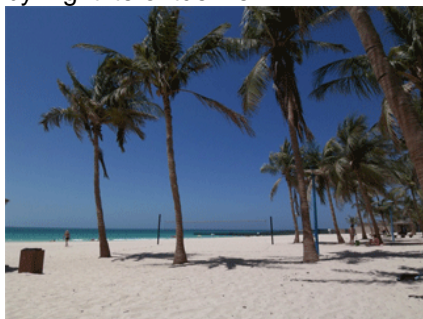
Jumeirah Beach Park

Onze laatste nacht brengen we door aan boord in de haven van Dubai, dus dit is hét moment om 'Dubai by night' te ontdekken.