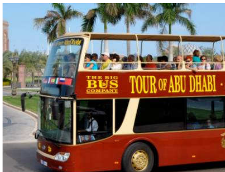
Hop on hop off bus tour Abu Dhabi