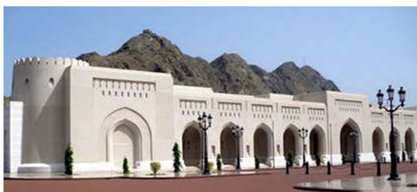
paleis in het havenstadje

Het havenstadje Muttrah kan u gemakkelijk op eigen houtje bezoeken, want ons schip ligt op wandelafstand, of u kan hier een begeleide wandeling maken met een gids (+/- 40 EUR). In het havenstadje is een traditionele souk waar u tal van souvenirs kan kopen.