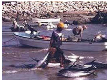
vissers op Seeb Beach