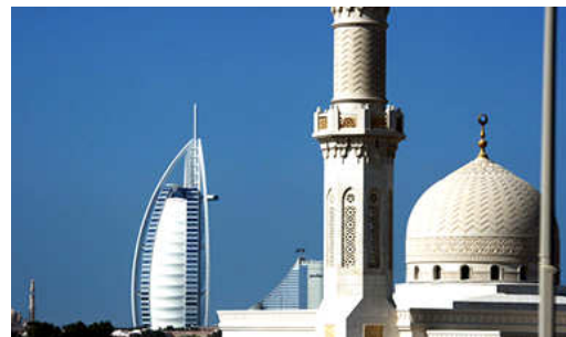
Dubai Moskee met Burj Al Arab op de achtergrond