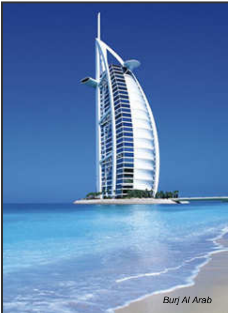
Burj Al Arab