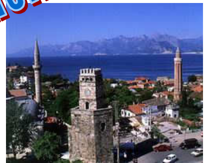
Oude stad Antalya